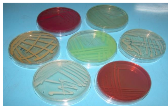
شکل ۱: ظهور پرگنه گونه‌های مختلف ویبریو بر روی محیط کشت جامد.

در مرحله بعدی با انجام آزمایش اکسیداز و ویبریو استاتیک 150 \mu\text{g} کلیه نمونه‌های اکسیداز منفی و مقاوم به ویبریو استاتیک 150 \mu\text{g} نیز از رده خارج و سایر آزمایش‌های بیوشیمیایی بر روی نمونه‌های گرم منفی، اکسیداز مثبت و حساس به ویبریو استاتیک انجام شد. آزمایش‌های بیوشیمیایی شامل آزمایش اکسیداز، آزمایش کاتالاز، آزمایش MR/VP، تولید اندول، آزمایش حرکت، آزمایش اکسیداتیو - تخمیری O/F، آزمایش‌های تخمیرکننده که شامل محیط‌های گلوکز، اینوزیتول، مانیتول، رامینوز، سوکروز، سوربیتول، آرابینوز، فروکتوز با معرف فنل رد، آزمایش ONPG (بتاگالاکتوزیداز) یا مصرف لاکتوز، آزمایش‌های هیدرولیز کننده شامل ژلاتین و اوره، آزمایش‌های دکربوکسیله کننده شامل